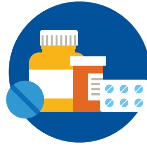
Выдача рецептов на лекарства