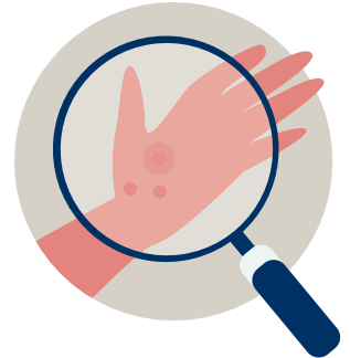
피부과 (스킨 케어)