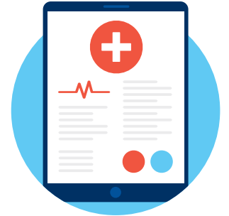
원격 모니터링 서비스