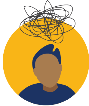
정신 건강 상담