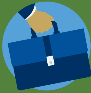
가계 소득 변경