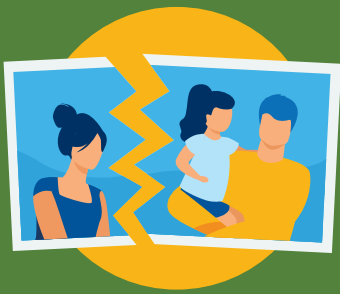
가구 변경 (부양가족, 사망, 이혼)