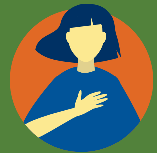
미국에서 시민권이나 합법적 체류 신분 획득