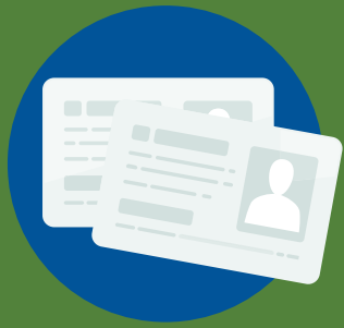
건강 보험 보장 상실